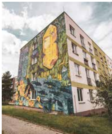
Od 14. do 19. června se v Plzni koná street art festival WALLZ.

Evropský den sousedů je komunitní akce, jež si za hlavní cíl klade pečovat o dobré sousedské vztahy. Přípravují ho lidé z DEPO2015 za pomoci dalších organizací. Program je uspořádán tak, že se 19., 25. a 26. června koná v okolí komunitních center – v ohniscích – odpovídající program pro veřejnost. V podvečer v sobotu 26. června je na programu