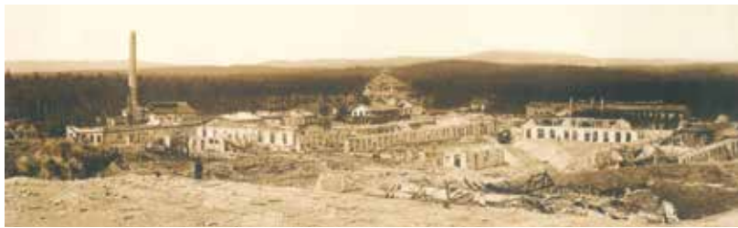
Bolevecká munička po výbuchu.

V roce 1900 byla v Bolevci Škodovými závody postavena zkušební střílna pro zbraně, které se ve Škodovce vyráběly. Za první světové války byla střílna přeměněna na muniční továrnu, v níž roku 1917 pracovalo 2 600 osob. Kvůli neopatrnosti došlo k výbuchu, jehož následky byly katastrofální. Výbuchy byly vlastně tři – první ve 13:35 hod., třetí a největší ve 14:55 hod. Následně továrnu zachvátil požár. Zahynulo více než 200 osob, zraněných byly stovky. Tlaková vlna rozbila okna až v Plzni. Vyšetřování katastrofy nepřineslo žádný výsledek. Hlavním viníkem byla zřejmě sama rakouská vojenská správa, která požadovala stále navýšení výroby, ale nezařídila včas odvoz vyrobené munice, takže se v závodech nahromadilo podstatně více trhavin, než dovolovaly bezpečnostní předpisy, 240 obětí bylo následně po-