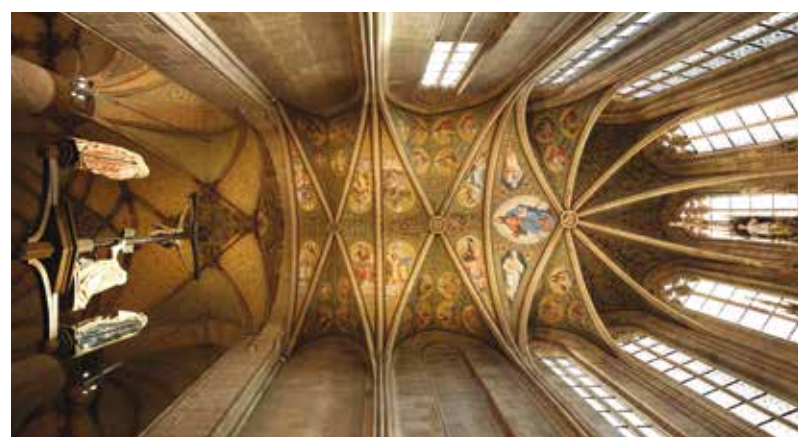
Interiér katedrály sv. Bartoloměje prošel náročnou revitalizací. Turistické informační centrum pořádá v katedrále komentované prohlídky.

Turistické informační centrum (TIC), jehož provoz zajišťuje organizace Plzeň – TURISMUS, bude nově zájemcům nabízet prohlídky katedrály sv. Bartoloměje.