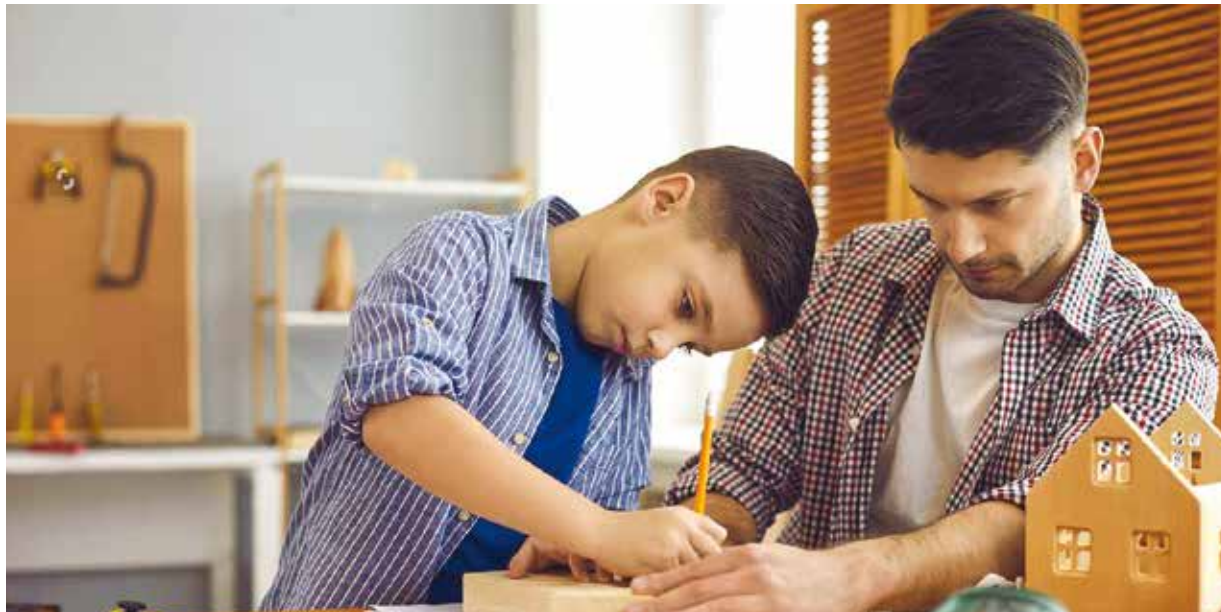
Tátohrátky aneb S tátou kutilem je jedna z červnových akcí, kterou nabídne rodinné centrum Vlnka.

MOTÝL, z. ú., a rodinné centrum Vlnka , obě organizace, jež sídlí na adrese Žlutická 2, zvou 11. června na Tátohrátky aneb S tátou kutilem , které budou oslavou Dne otců. Rodiny si zasoutěží, něco si společně vytvoří, zhlédnou divadlo, čeká je táborák a zahraje jim KB Akustic Band Plzeň. Dále pořádají ve dnech 12. – 16. července a 9. – 13. srpna přírodovědný příměstský tábor , na němž děti během výletů a her zažijí mnohá dobrodružství a seznámí se s rostlinnou i zvířecí říší. Program je připraven na každý den od 7:30 do 15:30 hodin. Ve dnech 19. až 23. července a 16. až 20. srpna se koná kreativní příměstský tábor , jehož hlavním tématem budou řemesla a výtvarné tvoření. A do třetice je připraven i sportovní příměstský tábor ve dnech 2. až 6. srpna . Všechny tyto příměstské tábory