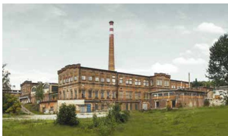
Jedním z plzeňských industriálních objektů, který by bylo možné navštívit během Industry Open, bude i Papírna na Slovanech.

I letos v létě mohou návštěvníci festivalu Industry Open objevovat a obdivovat zajímavé industriální objekty a místa v Plzni a Plzeňském kraji. Stejně jako v minulém roce budou letní víkendy na Plzeňsku patřit výletům po stopách průmyslu, komentovaným prohlídkám industriálních míst a dalším akcím pro příznivce technických památek, historické i současné dopravy nebo architektury. Městská příspěvková organizace Plzeň – TURISMUS připravila na letní víkendy od poloviny června do konce srpna pestrý program, ze kterého si vyberou fanoušci industriálu všech věkových kategorií. Podrobný program včetně prodeje vstupenek se objeví na webu www.industryopen.cz na začátku června.