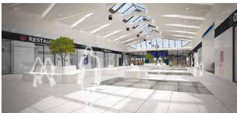
V budově plzeňského hlavního nádraží bude po její přestavbě i obchodní pasáž.

„Tato rekonstrukce navazuje na modernizaci nástupiště a dalších částí stanice, která proběhla v minulých letech. Hlavním předmětem prací je celková rekonstrukce památkově chráněné výpravní budovy z roku 1908. Zahrnuje především opravu střešního a obvodového pláště a úpravy vnitřních prostor v přízemí a patře odbavovací haly pro zlepšení služeb pro cestující,“ vysvětlil generální ředitel Správy železnic Jiří Svoboda. Zcela se přestaví horní hala, která bude sloužit jako otevřený prostor čekárny v podobě obchodní pasáže s komerčními jednotkami po obou stranách. Snadnější překonání výškového rozdílu mezi hlavní a horní halou zajistí eskalátory a výtahy. Samozřejmostí