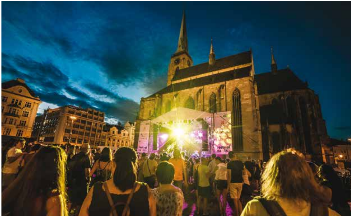
Konec prázdnin v Plzni opět zpríjemní multizánrový Festival na ulici.

Multizánrová přehlídka chce přispět k restartu kultury