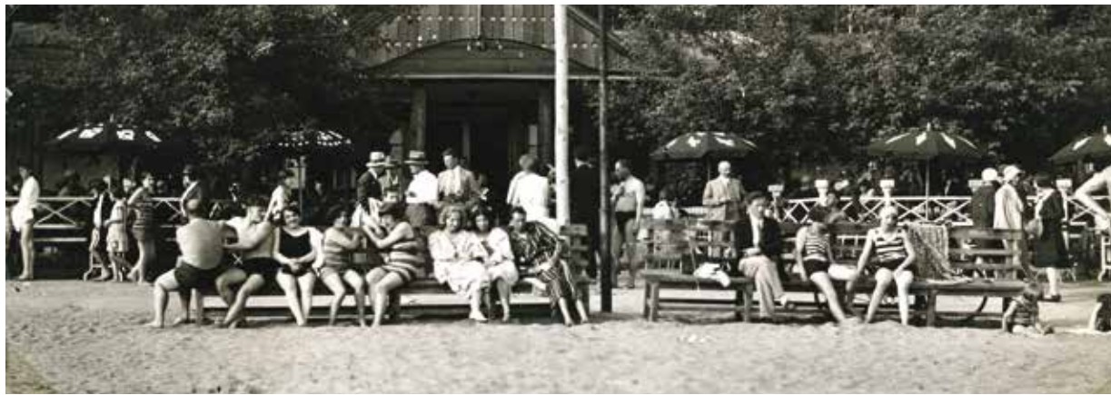
Na Velkém Boleveckém rybníku bývalo vždy rušno.

Stejně jako Skvrňany, o nichž jsme psali v květnovém vydání Radničních listů, ani Bolevec příliš starou vesnici nepřipomíná. Atmosféru navodí snad jen několik staveb roztroušených mezi paneláky na staré bolevecké návsi či statky v Malém Bolevci. Přesto vesnice patřila ve své době k největším v Čechách. Její původní název zněl Volovec a je odvozen od osobního jména Volimír, zkráceně Volen či Vol', tudíž se jednalo o Volovu ves. Ujal se název Voloves či Volovec, v 15. až 17. století bývá uváděna jako Olovec, název Bolevec je doložen až z roku 1728.