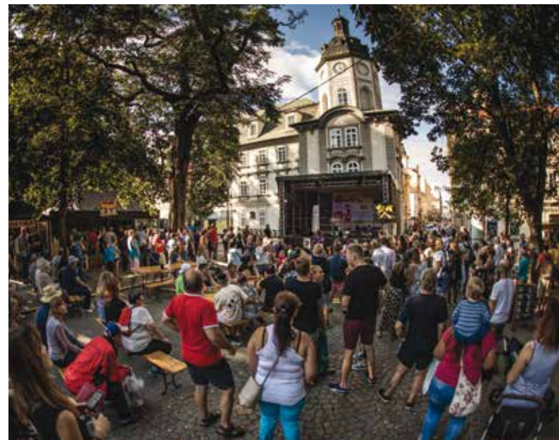
Pilsen Busking Fest láká na pouliční umění a o diváky neměl v minulých letech nouzi.