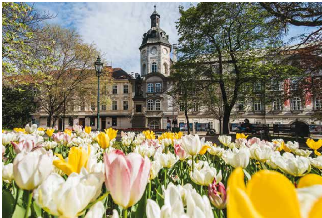
Letos na jaře zdobily centrum Plzně především barevné tulipány. V červnu je vystřídají letničky.