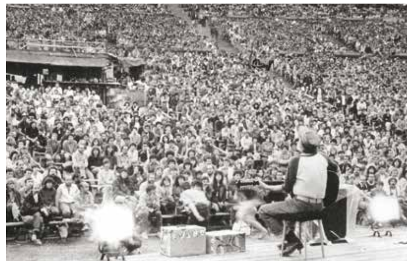
Dobový snímek ukazuje, že muzikantům na Portě naslouchal zaplněný lochtotinský amfiteatr.

Před čtyřiceti lety, v roce 1981, se v Plzni poprvé uskutečnil celostátní festival Porta a zakotvil tu na krásných i složitých 10 let. Festival, který se věnoval trampské hudbě, country a folku a přiváděl do Plzně nejlepší kapely a písničkáře té doby, navštěvovaly desítky tisíc diváků a trampů z celé republiky. Z původního místa na bývalém výstavišti (za dnešním OC Plzeň Plaza) se festival přesunul do lochtotinského amfiteátru, v jehož sousedství po dobu konání Porty vyrostlo stanové městečko. Porta přinášela do tehdy šedé a smutné Plzně se skvělou muzikou i závan svobodného myšlení spojeného s trampským světem. Vzpomínky na léta Porty v Plzni, spojené se všemi paradoxy té doby, přinese v červenci venkovní výstava ve Smetanových sadech. Pokud bude epidemická situace příznivá, výstavu doprovodí i několik koncertů umělců, kteří jsou s Portou v Plzni spojeni. (red)