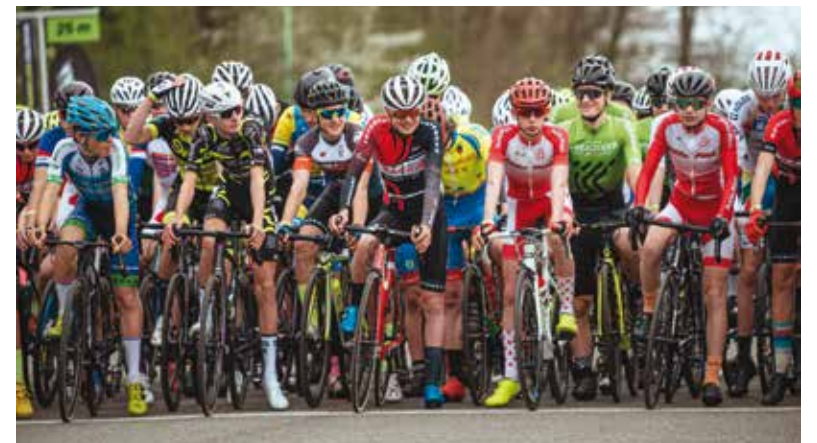
Na start cyklistických závodů Grand Prix West Bohemia se postavilo na dvě stě padesát kadetů a juniorů z celé Evropy.

Město Plzeň přispělo na úhradu technického a organizačního zajištění závodů. Dlouhodobě v rámci svých dotačních programů zaměřených na podporu sportující mládeže přispívá také Kreuzigerově cyklistické akademii. (red)