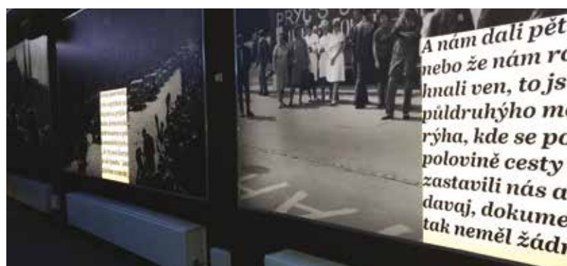
Výstava Osvobození bez svobody je k vidění v Návštěvnickém centru Plzeňského Prazdroje.

„Výstava Osvobození bez svobody představuje osudy lidí, kteří dějiny 20. století prožili na vlastní kůži. Tvoří ji příběhy pamětníků reprezentující rozmanitou historickou zkušenost obyvatel kraje, jenž sám sebe označoval za pevnou hráz socialismu