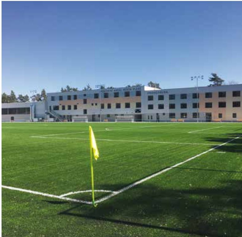
Areál Prokopávka už opět může sloužit ke sportování. Prošel rozsáhlou rekonstrukcí.

Na zrealizování této první etapy rekonstrukce Prokopávky město vynaložilo 256 milionů korun. Plzeň by v budoucnu ráda realizovala i druhou etapu přestavby. Ta by například zahrnovala výstavbu dvoupodlažní budovy letní restaurace či vybudování dalších víceúčelových sportovišť. (red)