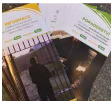
Brožury a letáky s informacemi, kde hledat pomoc.

Cílem těchto materiálů je maximálně usnadnit orientaci ve službách, které poskytují těmto osobám pomoc a podporu při návratu do běžného života. „Je zcela správné, aby pachatel trestného činu byl stíhán a aby vykonal jemu uložený trest. Nicméně poté, co tento trest vykoná, je jeho dluh vůči společnosti vyrovnán. Takový člověk by pak měl mít možnost se po skončení trestu vrátit do běžného života. Informační brožura by mu měla usnadnit základní orientaci při řešení různých životních situací, se kterými se bezprostředně po propuštění setkává,“